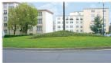
Rond-point de l'Europe

L'association Loisirs et Fêtes du Coq Chantant anime régulièrement le quartier grâce à des lotos, brocantes et les soirées dansantes sont de véritables succès.