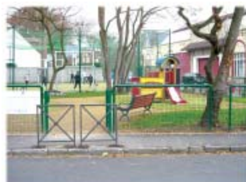
Stade de quartier du Bois Saint-Denis

Inauguré au mois de mai dernier, le nouveau stade de quartier est un équipement sportif de proximité supplémentaire.